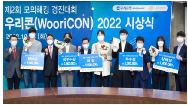
우리은행 모의해킹 경진대회 대상 (Creative 거북이 학습그룹 프로그램)