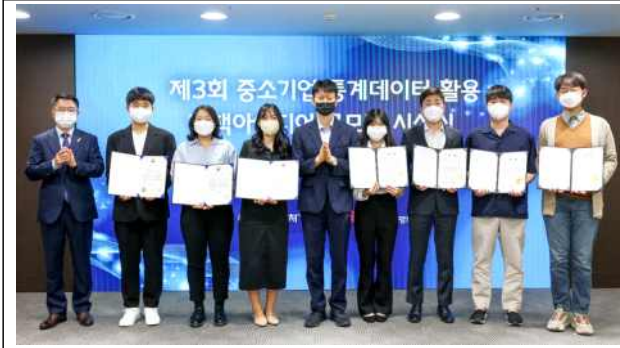
중소기업 통계데이터 활용 정책아이디어 공모전 중기부장관상 (응용통계학전공 전공연계 프로그램)