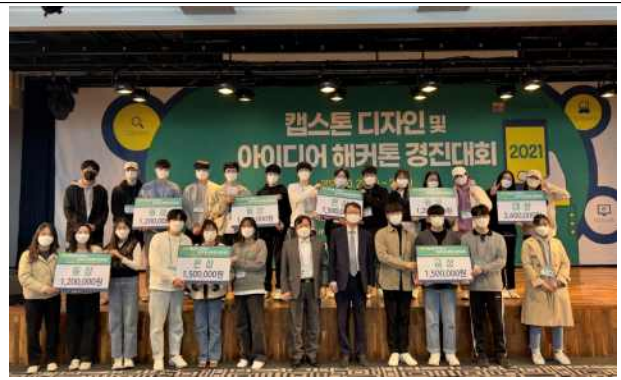
한국인터넷정보학회 캡스톤디자인 및 아이디어 해커톤 경진대회 대상 (인공지능전공 전공연계 프로그램 참여)