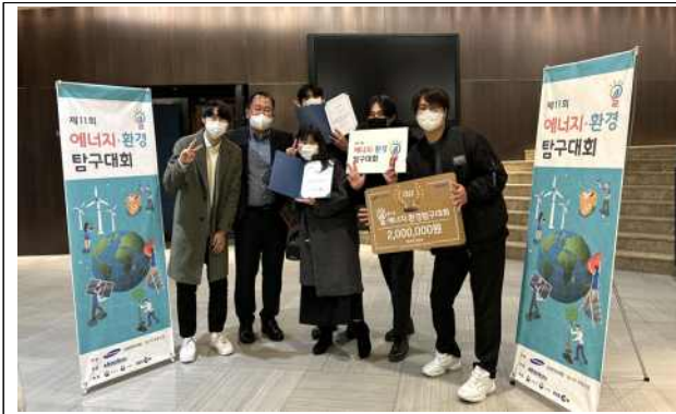
에너지-환경 탐구대회 환경부장관상 (기계공학전공 전공연계 프로그램)